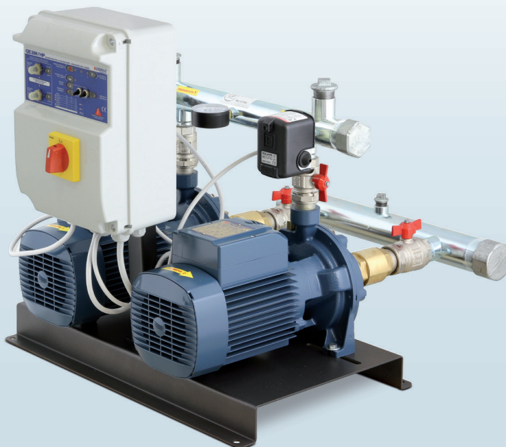
CB2 - 2CP